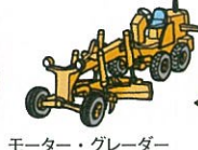
モーター・グレーダー