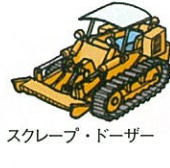
スクレープ・ドーザー